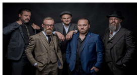
Black Cat Biscuit